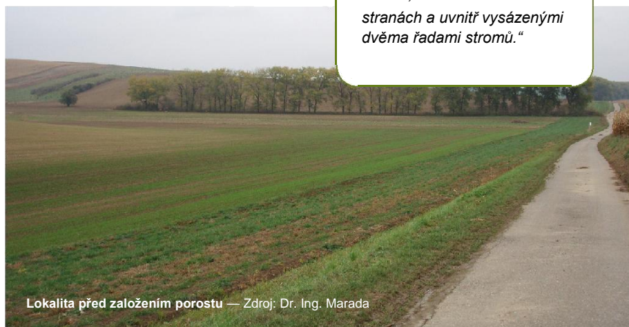
Lokalita před založením porostu — Zdroj: Dr. Ing. Marada

„Atraktivní, prostupnou, mozaikovitou, vodě a větru odolnou zemědělskou krajinu s odpovídající druhovou pestrostí volně žijících živočichů a planě rostoucích rostlin můžete získat založením jednoduchého biokoridoru tvořeného travobylinným lemem, řadou keřů na obou stranách a uvnitř vysázenými dvěma řadami stromů.“