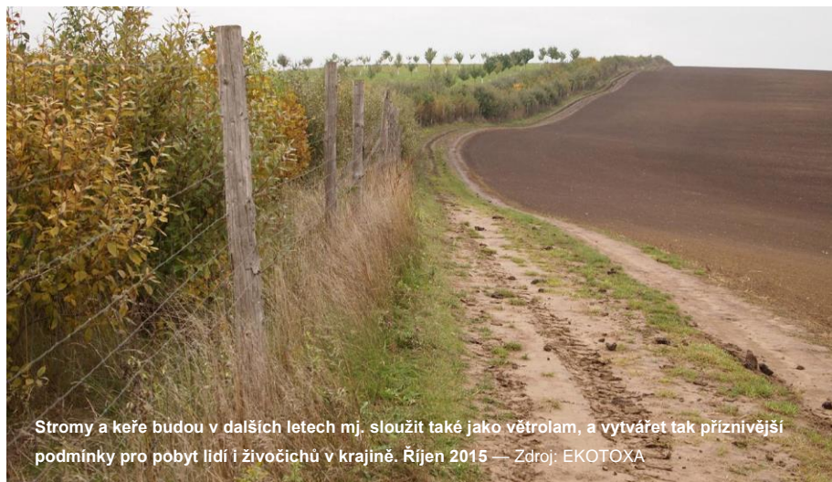
Stromy a keře budou v dalších letech mj. sloužit také jako větrolam, a vytvářet tak příznivější podmínky pro pobyt lidí i živočichů v krajině. Říjen 2015