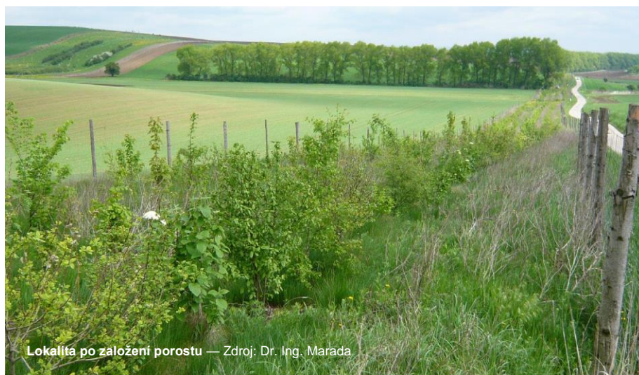
Lokalita po založení porostu